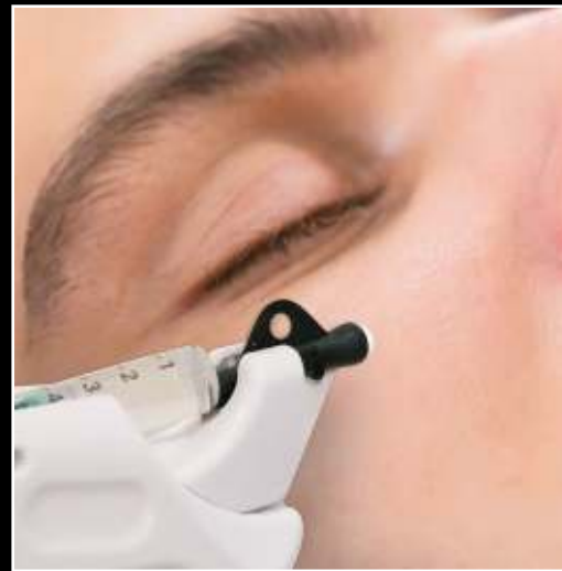
Eine INFUZION®-Anwendung dauert nur 20 Minuten pro Behandlungszone.

INFUZION® eignet sich zur Behandlung an Gesicht, Hals, Dekolleté und Händen. Auch einzelne Problemzonen wie dunkle Augenringe, Krähenfüße, Nasolabial- und Mundfalten lassen sich erfolgreich behandeln. Das Ergebnis ist sofort sichtbar: Wangen erhalten mehr Volumen, feine Linien und Falten sind geglättet. Die Haut wird tiefenwirksam mit Feuchtigkeit versorgt und erstrahlt in einem frischen Teint und einem schönen und ebenen Erscheinungsbild.